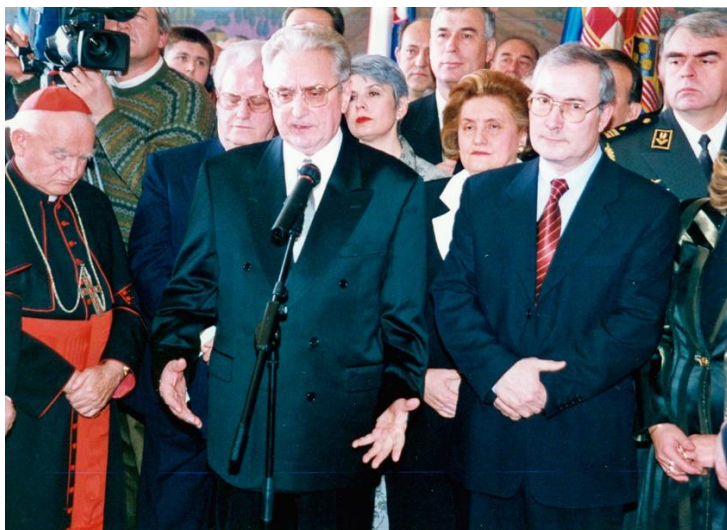
Predsjednik Tuđman sa suradnicima i uglednicima