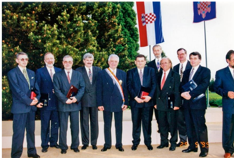
Predsjednik Tuđman s akademikima i sveučilišnim profesorima