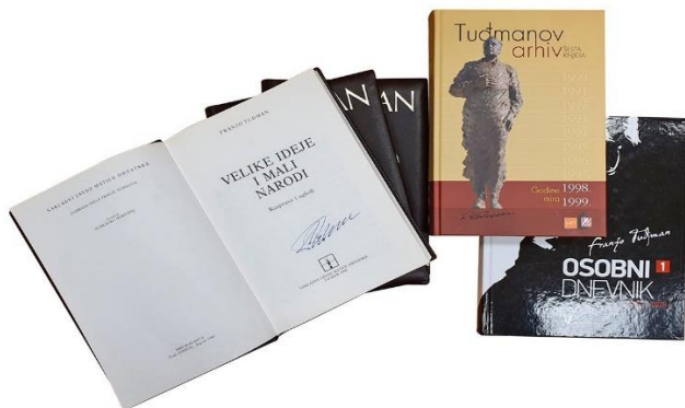
Neka od Tuđmanovih djela

svjetskim sveučilištima (Harvard, Johns Hopkins, Yale, Stanford, Pennsylvania), a bio sam i najbliži suradnik Franje Tuđmana, moje općenite ocjene stvaralaštva Franje Tuđmana imaju dodatnu vjerodostojnost.